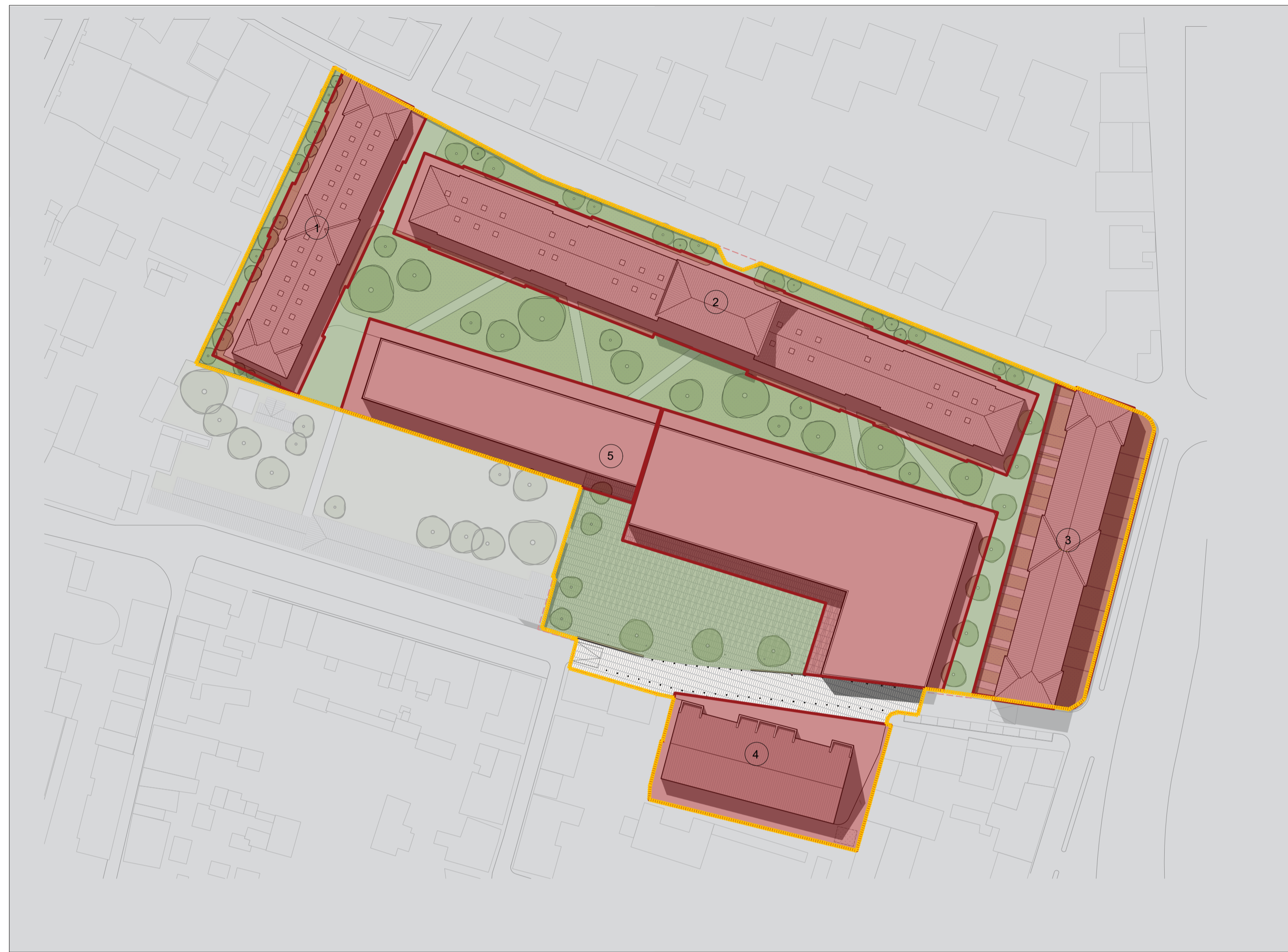
01 PLANIMETRIA_AREA 1_AREA PRIVATA_EX CASERMA POZZUOLO DEL FRIULI SCALA - 1:1000